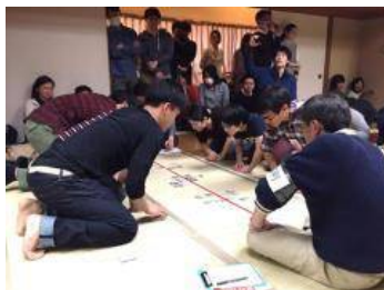
白熱する「King of JMK」。大人たちの真剣勝負に、会場は独特の緊張感に包まれる(2月27日)

「子供たちが郷土を知る教材」、「正月の遊び」という郷土かるたのイメージを覆す試みもあります。上毛かるたには、18歳以上が日本一を競う「King of JMK」(JoMo Karuta)というイベントが行われています。