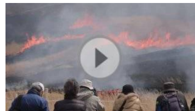
春告げる山焼き…箱根町仙石原